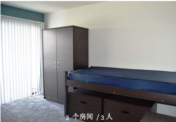
3 个房间 / 3 人