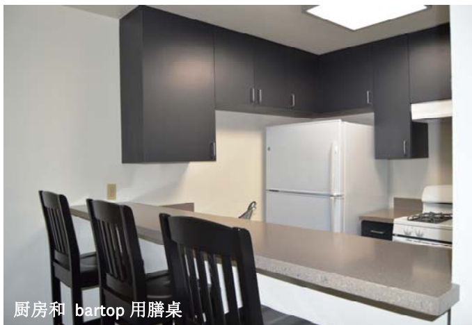
厨房和 bartop 用膳桌