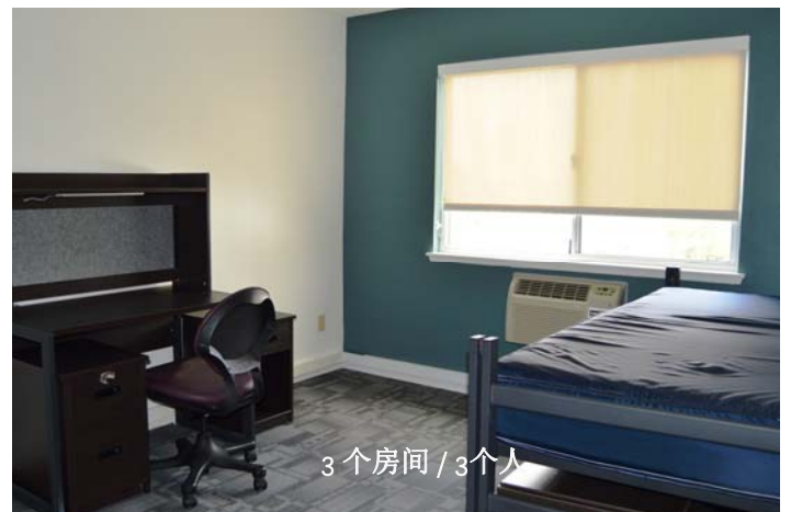
3个房间 / 3个人